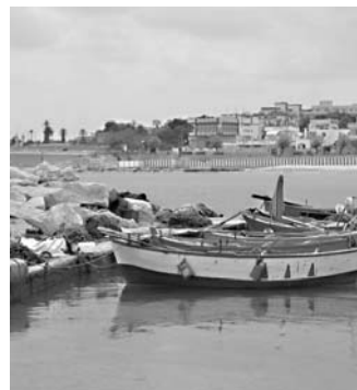
LUCIA DE MARI

Stagione balneare quasi al via ma restano problemi di gestione e, soprattutto, di rimozione del degrado